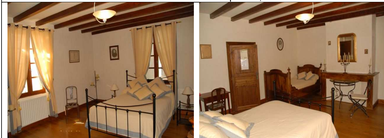
Chambre Julie : 32 m 2 + salle de bain + WC privatif ; 1 lit 140 + 1 lit 120