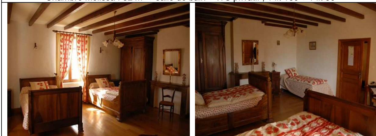
Chambre Irma : 32 m 2 + salle de bain + WC privatif ; 2 lits 120 + 1 lit 90