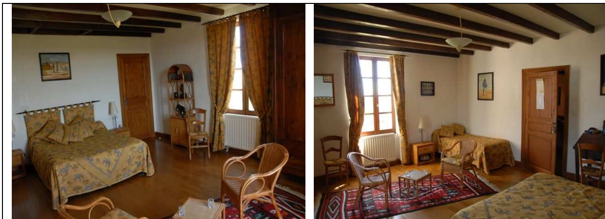
Chambre Mélissa : 32 m 2 + salle de bain + WC privatif ; 1 lit 160 + 1 lit 90