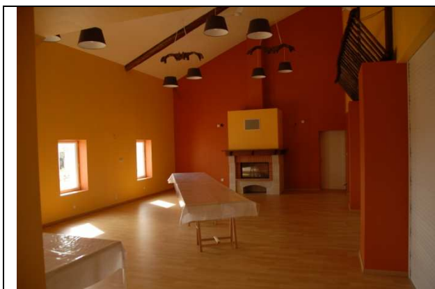
Salle Denise : 50-60 personnes assises